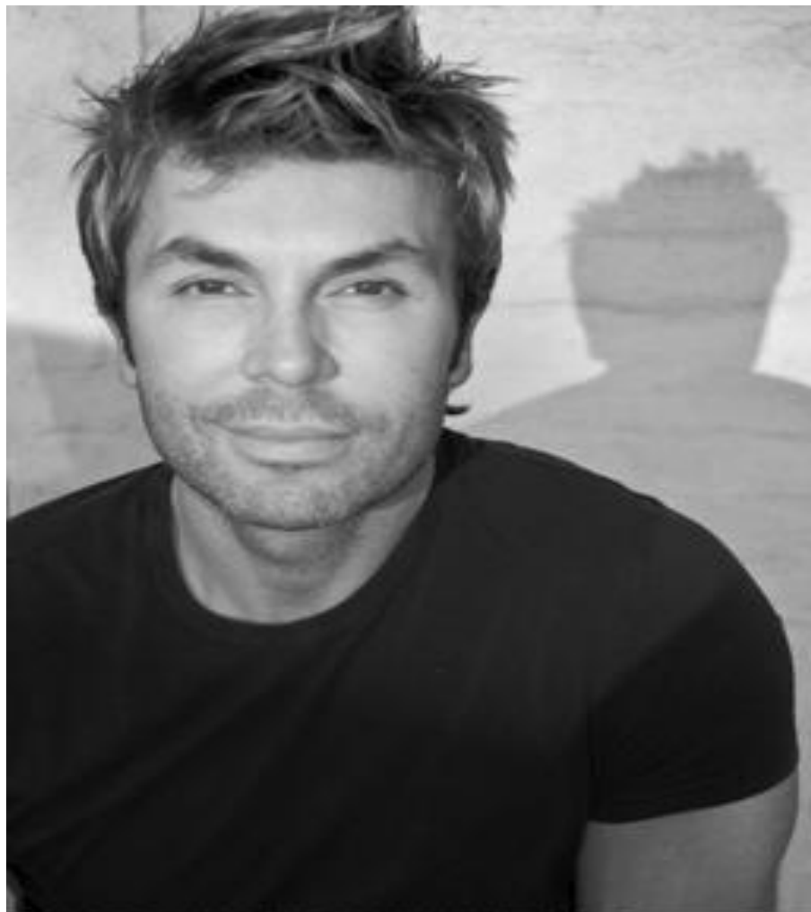
webdesign og forsidefoto: Christopher Mørch Husby